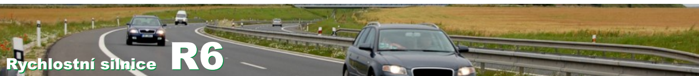
Průměrné denní intenzity, údaje v tisících vozidel / 24h (v obou směrech). Údaje z automatických sčítačů, v letech 2000, 2005 a 2010 doplněno o údaje z celostátního sčítání (označeno znakem *).