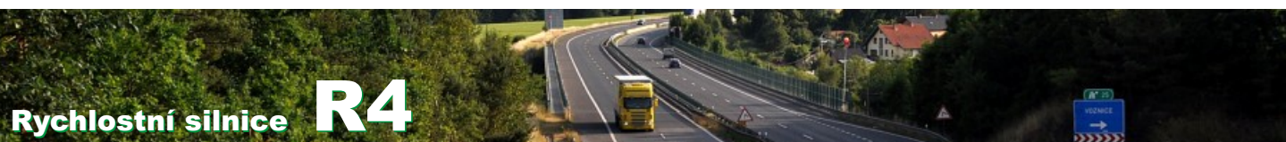
Průměrné denní intenzity, údaje v tisících vozidel / 24h (v obou směrech). Údaje z automatických sčítačů, v letech 2000, 2005 a 2010 doplněno o údaje z celostátního sčítání (označeno znakem *).