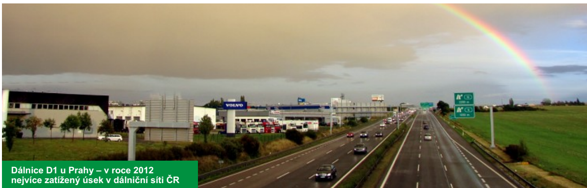
Dálnice D1 u Prahy – v roce 2012 nejvíce zatížený úsek v dálniční síti ČR

automatické sčítání dopravy 1994 – 2012 průměrné denní intenzity na dálnicích a rychlostních silnicích ČR, vývoj 1994 – 2012