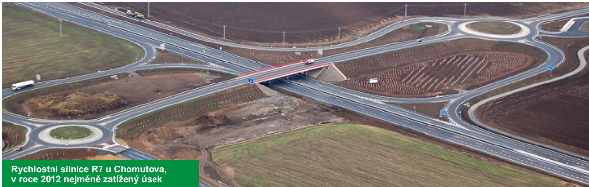
Rychlostní silnice R7 u Chomutova, v roce 2012 nejméně zatížený úsek