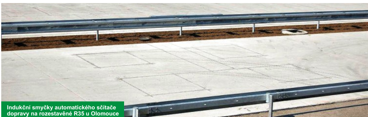
Indukční smyčky automatického sčítáče dopravy na rozestavěné R35 u Olomouce