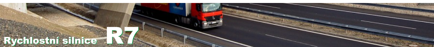
Průměrné denní intenzity, údaje v tisících vozidel / 24h (v obou směrech). Údaje z automatických sčítačů, v letech 2000, 2005 a 2010 doplněno o údaje z celostátního sčítání (označeno znakem *).